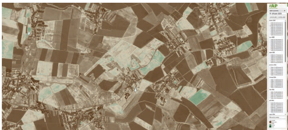
AgraSat - podrobné satelitní snímky Vašich pozemků.

AgraSat je nedílnou součástí Klientského portálu a pro naše klienty tedy kdykoliv dostupný.